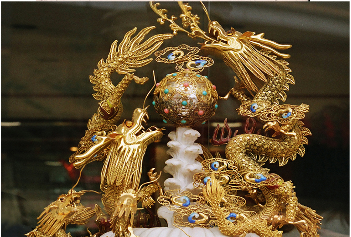
Луны Цигая на постаменте из Белого Нефрита, Алмаза и Хрусталя.